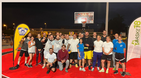
Près de 50 participants en 2025 !

Les horaires : Rendez-vous le 12 mai 2026 à 18h30 sur place - Fin de la compétition prévue vers 22h00